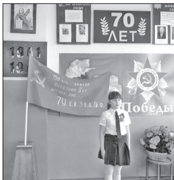
Уголок памяти. Часовой у знамени Победы

Великая Отечественная война коснулась каждой российской семьи. Каждая семья понесла потери. Нельзя вернуть тех, кого больше нет. Но можно предотвратить грядущие утраты.