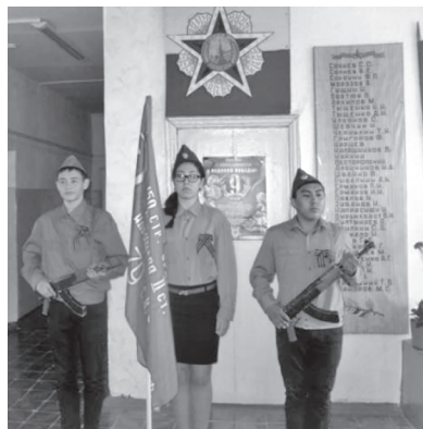
МОУ «Средняя общеобразовательная школа пос. Липовский»