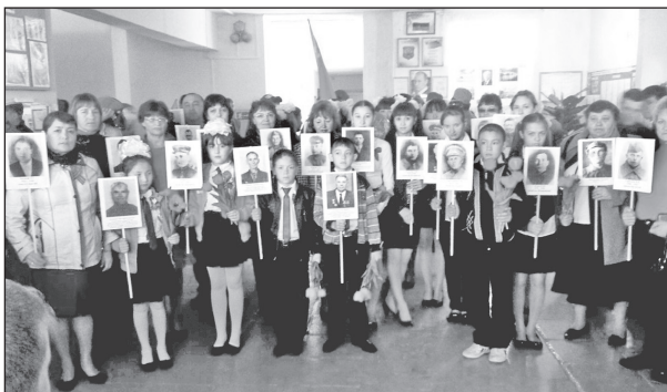
Акция «Бессмертный полк». 9 мая 2015 г.

Мы — наследники Великой Победы. Значит, наша задача стать достойной сменой уходящему поколению, любить свое Отечество, уметь защитить то, что досталось дорогой ценой, и помнить подвиг нашего народа, сберечь эту память — сберечь по призыву сердца, совести и долга, чтобы по праву называться наследниками Победы.